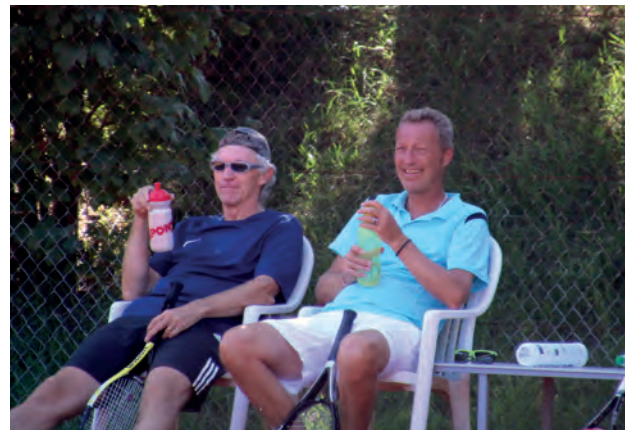
Pause und Taktikbesprechung